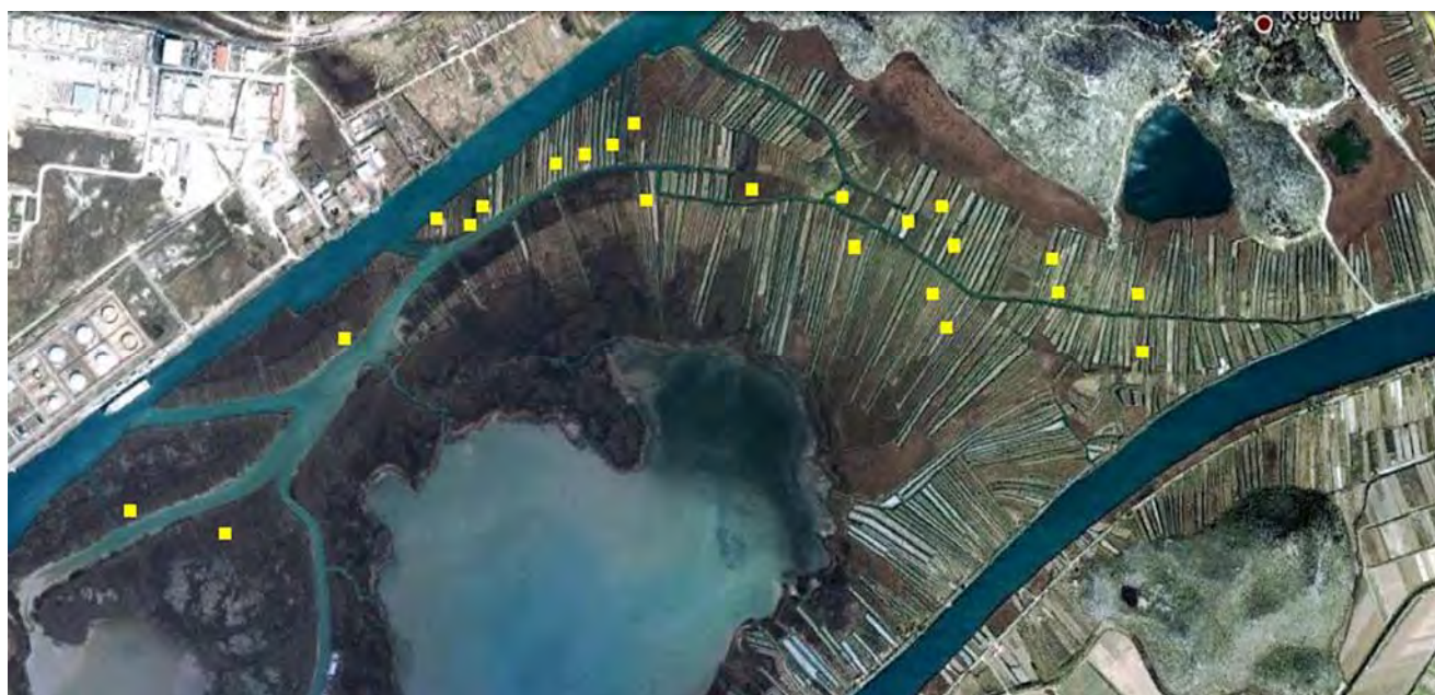
Slika 11. Približan prikaz brojnosti i rasporeda teritorija Kokošice na gniježđenju tijekom proljeća 2011.

Metodom prebrojavanja u točki uz korištenje zvukovnog vaba, na 13 točaka uz rijeku Lisnu ( slika 2. ) tijekom 2007., 2008., 2009., 2010. i 2011. dobivene su brojnosti ptica močvarica lokalne gnjezdeće populacije koje su prikazane u tablici 3. Radi se o relativnim brojnostima parova ptica prebrojanih s 13 točaka u močvarnim staništima jezera Parila uz rijeku Lisnu.