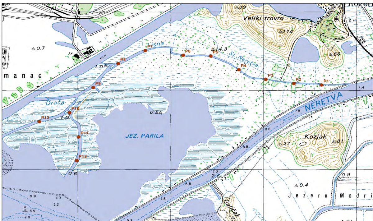
Slika 2. Smještaj postaja uz rijeku Lisnu na jezeru Parila.

Na području jezera Parila koristili smo metodu točkastog prebrojavanja (point – count method). Obradeno je istih 13 postaja kao i tijekom 2007., 2008., 2009. i 2010. Postaje su razmaknute oko 400 m i poredane duž transekta duljine približno 5 km, duž rijeke Lisne (slika 2.). Postaje su obilježene čamcem. Pri svakom obilasku, obavljani su po jedan dnevni i jedan noćni (za štijoke i Kokošice) transekt. Prilikom noćnog transekta, korištena je tehnika zvukovnog vaba (The Call Play Back Method) za izazivanje teritorijalnog glasanja skrovitih triju vrsta štijoka (Riđa, Siva i Mala štijoka) i Kokošica. Na svakoj postaji ptice su evidentirane tijekom 10 minuta, a za to vrijeme je motor čamca obavezno ugašen.