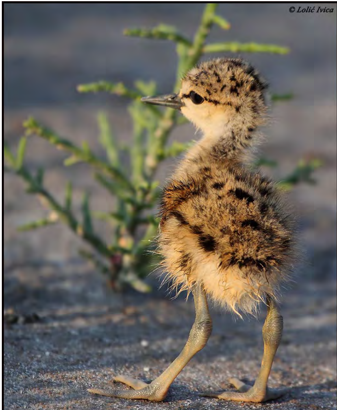
Slika 7. Ptić Kulika Sljepčiča. Ova vrsta je brojna gnjezdarica na taložnici.

Valja spomenuti da je ove godine za razliku od 2010. primijećeno da na taložnici boravi i znatno veći broj Kulika Sljepčiča ( slika 7. ) na gnježđenju. S obzirom da ova vrste nije ugrožena ona nije predmet monitoringa, a okvirne podatke o njenoj brojnosti donosimo samo kao još jednu potvrdu da je u periodu od sredine travnja do srpnja potrebno ograničiti bučne radove s teškom mehanizacijom u neposrednoj okolici taložnice.