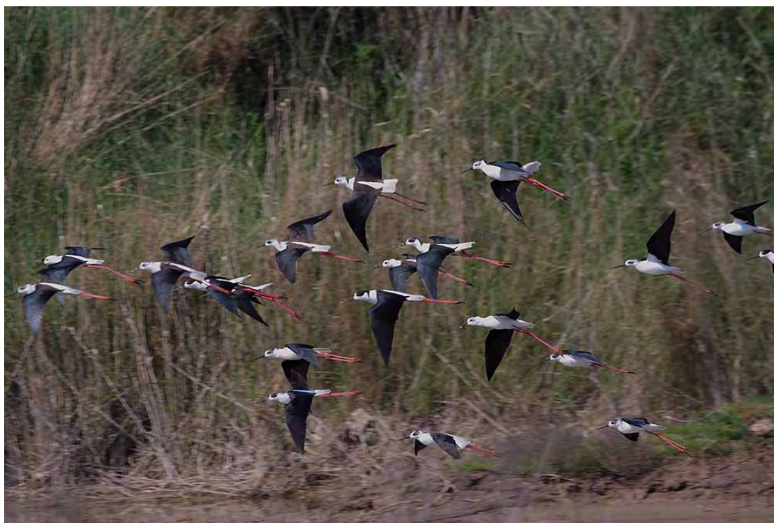
Slika 10. Vlastelice na taložnici prije gniježđenja.

Rezultati ovogodišnjeg monitoringa vrlo ohrabruju, jer je sada vidljivo da je taložnica, kao i za Morskog Kulika, važna i da predstavlja kvalitetno i sigurno stanište. Sve zaštitne mjere predložene za Morskog Kulika vrijede i za ovu vrstu.