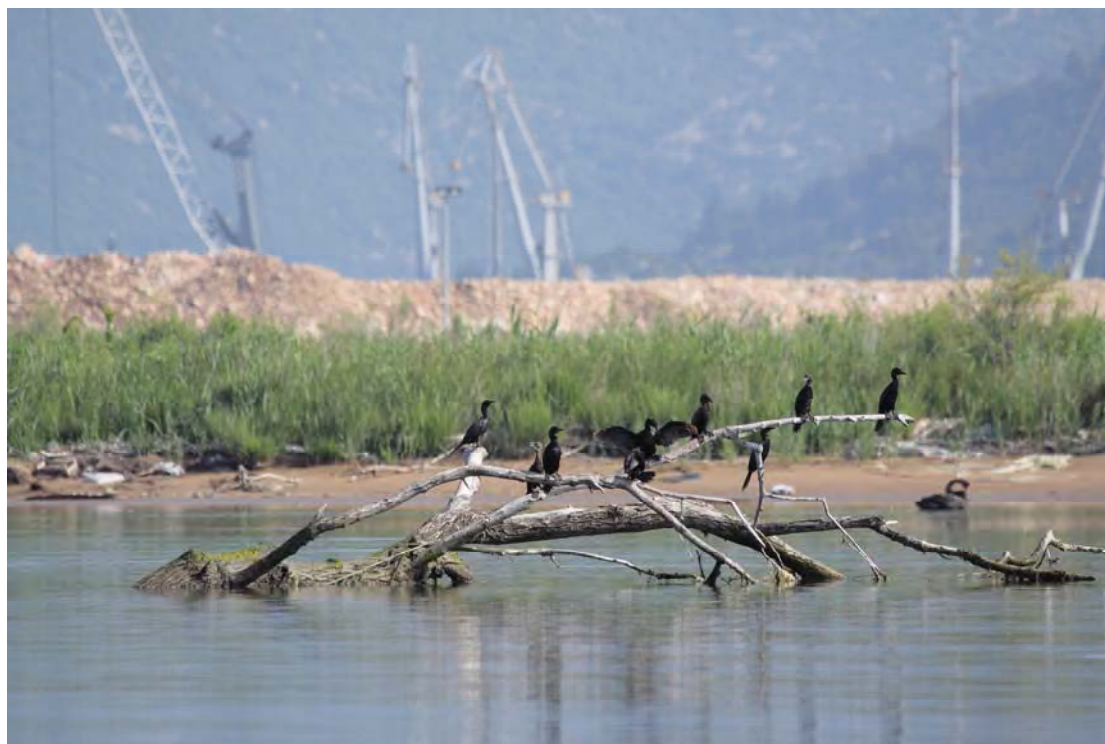
Slika 12. Mali vranaci i Crni Labud na ušću kanala Vlaška. Zimujuća populacija Malih Vranaca je znatno porasla, dok je Crni Labud odbjegla ptica iz nekog ZOO-a ili od nekog uzgajivača i nema važnosti za ptičji svijet ušća Neretve.

Iz tablice je vidljivo da je kod gotovo svih vrsta došlo do znatnijeg porasta brojnosti u odnosu na 2010. godinu. To znači da dosadašnji radovi u luci Ploče nisu imali utjecaja na zimujuću ornitofaunu jezera Parila i rijeke Lisne. Prevladavajući uzlazni trend kod većine vrsta ptica pripisujemo znatnom porastu zaštite ptica i reguliranja lova koji se na području ušća Neretve odvija posljednjih godina, dok se kod nekih vrsta radi o uobičajenim fluktuacijama povezanih s različitim uvjetima u raznim zimama.