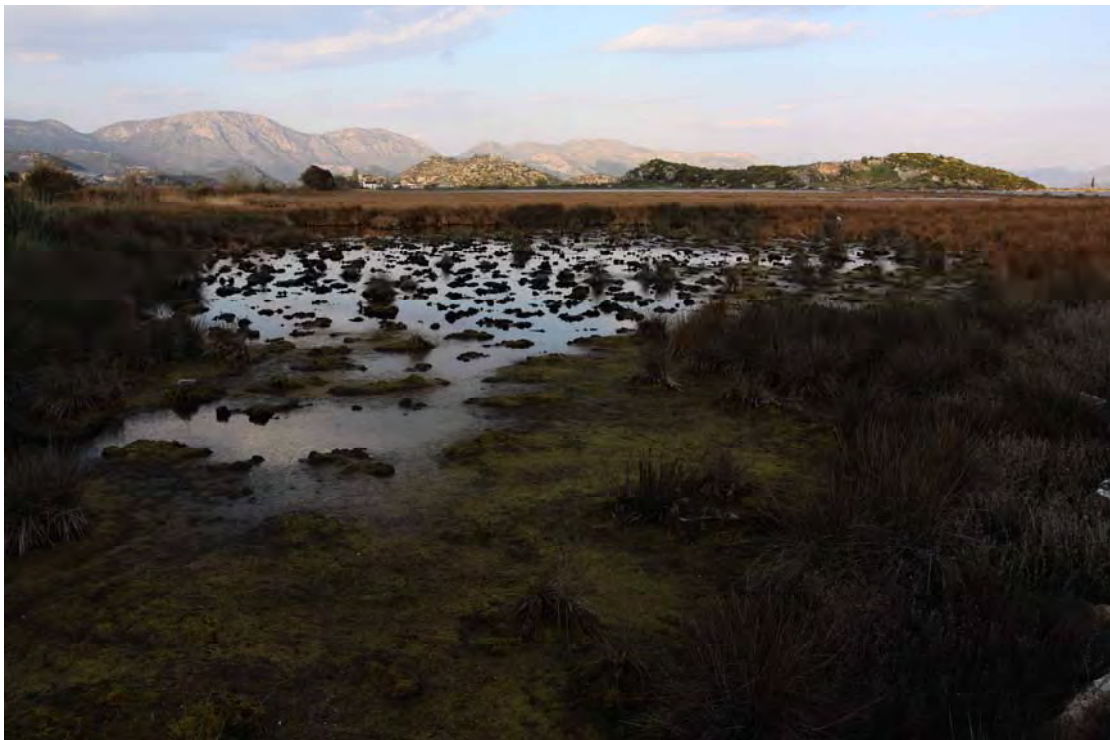
Slika 3. Obiđena su i sva ostala pogodna staništa za Morske Kulike i Vlastelice.

Na ovim područjima korištena je ista metodologija kao kod staništa u luci Ploče (totalno prebrojavanje). Također, korišteni su kvalitetni durbin i dalekozori (Swarovski SLC 8x56 B i durbin Swarovski AT 80 HD s okularom 20-60x). Povremeno je korištena i metodologija noćnog zvukovnog vaba.