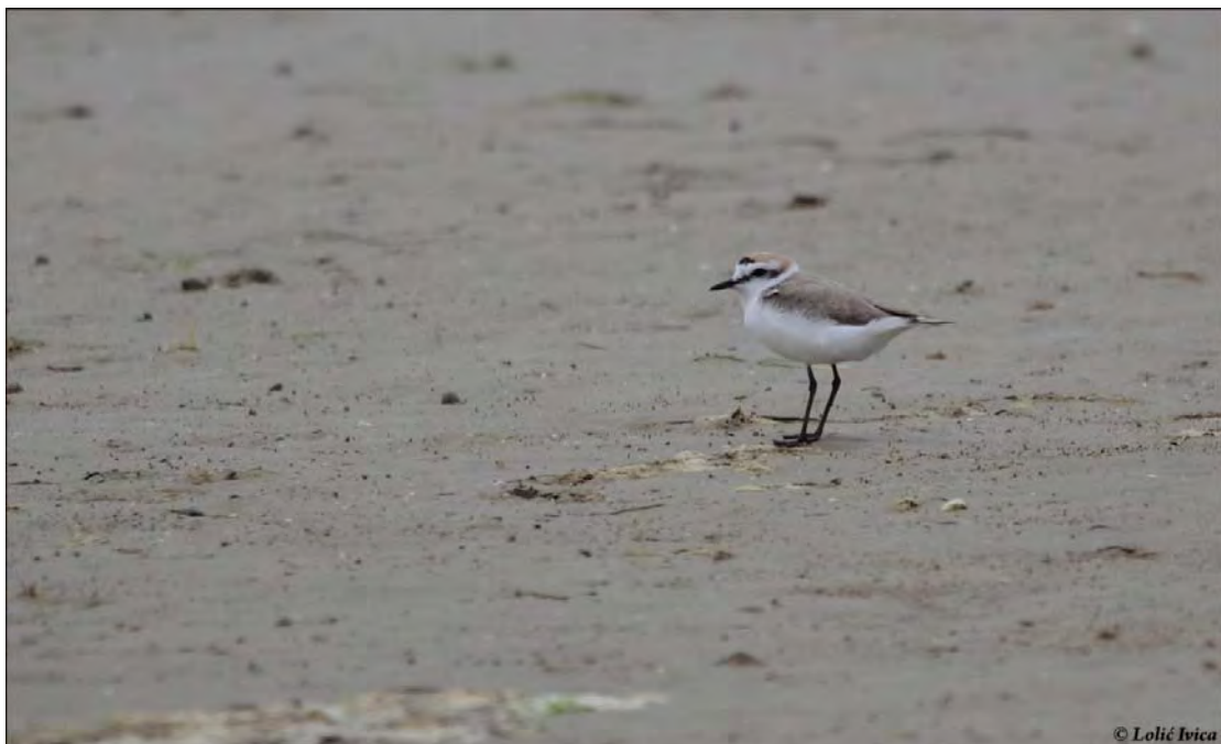
Slika 9. Morski Kulik

Kao što je gore rečeno, Neretvansku populaciju Morskog Kulika smo 2010. godine smatrali vjerojatno izumrlom, jer su posljednje ptice gnjezdilišno ponašanje pokazivale 2007. godine. Stoga je vrlo važno ponovno pojavljivanje i gniježđenje čak tri para. Najvjerojatniji razlog je postojanje taložnice morskog mulja na području luke Ploče gdje su gnijezdila dva para od ukupno tri. Stoga glavni razlog za povratak ove vrste na područje Neretve smatramo produbljivanje plovnog puta i taloženje tog materijala na području luke Ploče. S obzirom da su sva ostala pogodna staništa pod prevelikim antropogenim utjecajem, otvaranje ove taložnice je pružilo mogućnost Morskim Kulicima da se na miru hrane i koriste ovo, za njih pogodno, stanište. Stoga i ponovno gniježđenje 1 para kod Blaca smatramo posljedicom otvaranja taložnice, jer su i ptice tog para prije gnijezdeće sezone dobar dio vremena provodile na njoj.