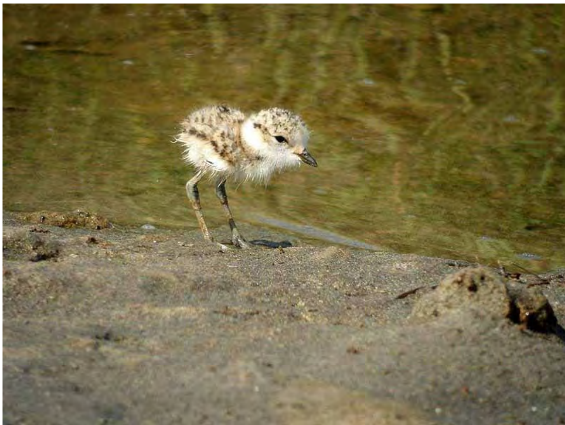
Slika 8. Ptić Morskog Kulika

Godine 2011. na taložnici u luci Ploče je došlo do naglog poboljšanja stanja gnijezdeće populacije Morskog Kulika na području ušća Neretve. Tijekom svibnja i lipnja na gniježđenju su nađena ukupno tri para, dva para na taložnici u luci Ploče i jedan par na pjeskovitom sprudu kod mjesta Blaca. Sva tri para su bila uspješna i promatrani su svaki sa po tri ptića. Osim ova tri para, na sprudu ispred samog ušća Neretve boravila je jedna nesparena ptica, a u Stonskoj solani su boravile dvije ptice koje nisu pokazivale gnjezdilišno ponašanje.