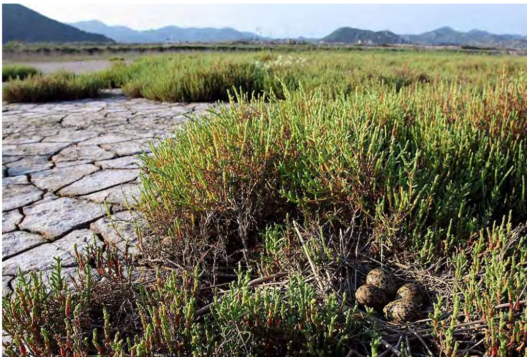
Slika 5. Gnijezdo Vlastelice u krugu taložnice.

Stoga, iako smo u izvješću za 2009. godinu naveli mišljenje da se radovi na terminalu za rasute terete mogu nesmetano odvijati cijele godine, ipak se pokazalo da su obavljani preblizu staništa Vlastelica, odnosno taložnice materijala nastalog produbljivanjem plovnog puta, te su ipak predstavljali preveliko uznemiravanje. Stoga smo u izvješću za 2010. naveli da bi iduće gnijezdeće sezone trebalo radove tijekom perioda gniježđenja Vlastelica, od sredine travnja do srpnja, ili planirati na područjima udaljenijim od taložnice ili obustaviti. Rezultati ovogodišnjeg monitoringa to mišljenje u potpunosti potvrđuju.