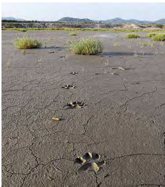
Slika 6. Tragovi psa na taložnici.

Primijećeno ja da taložnicu često obilaze psi lutalice koji mogu jako negativno djelovati na gnijezdeću populaciju ovih ptica. Na slici 6. se vide tragovi psa koji je pretraživao taložnicu.